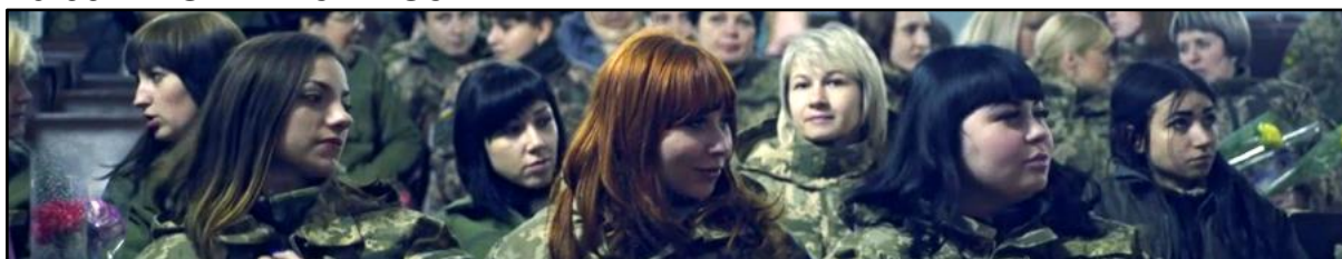
INNER WARS, Maša Kondakova, 2021, 68 min

Vse od začetka proruskega separatističnega gibanja v vzhodni Ukrajini so se boju za domovino pridruževale številne ženske prostovoljke in hitro spoznale, da pot do fronte za žensko ni tako enostavna. Praviloma so bile dodeljene na administrativne položaje in le redkim je uspelo priti na bojišče. Režiserka spremlja vsakdan treh neomajnih vojakinj, ki se obenem borijo na dveh frontah: proti separatistom in proti patriarhalnim predsodkom, ki jih obkrožajo.